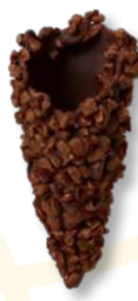
PISTACCHIO Cod. 14007 - Pz. 200