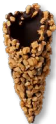
GRANELLA DI RISO Cod. 14026 - Pz. 200