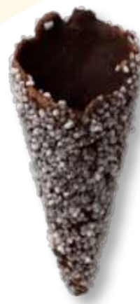
ZUCCHERO BIANCO Cod. 14024 - Pz. 200