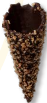
AMARETTO Cod. 14028 - Pz. 200