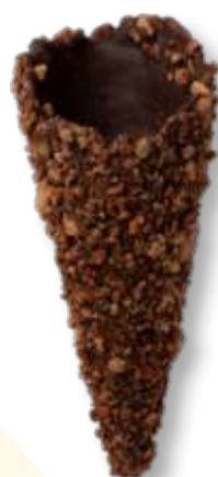
GRANELLA DI CACAO Cod. 14034 - Pz. 200