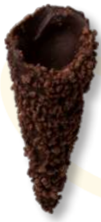
GRANELLA DI CAFFÈ Cod. 14035 - Pz. 200